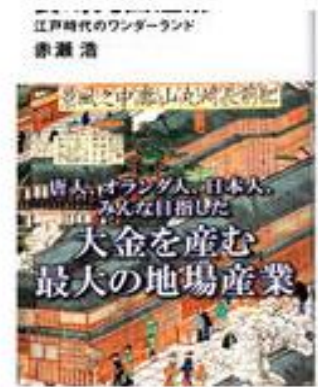
長崎丸山遊廓 江戸時代のワンダーランド ¥1,320