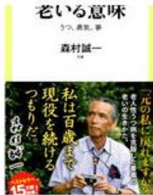
老いる意味 うつ、勇気、夢 ¥924