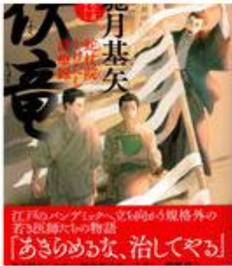
伏魔 蛇杖院かけだし診療録 ¥792