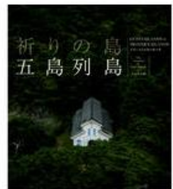
祈りの島五島列島 ¥2,200