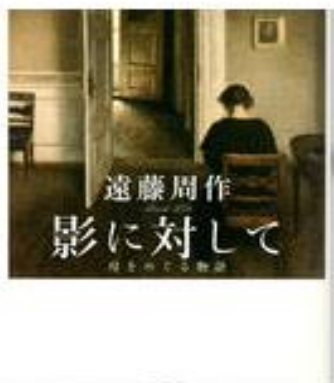
影に対して 母をめぐる物語 ¥1,760